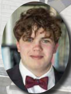
Door Van Bergen